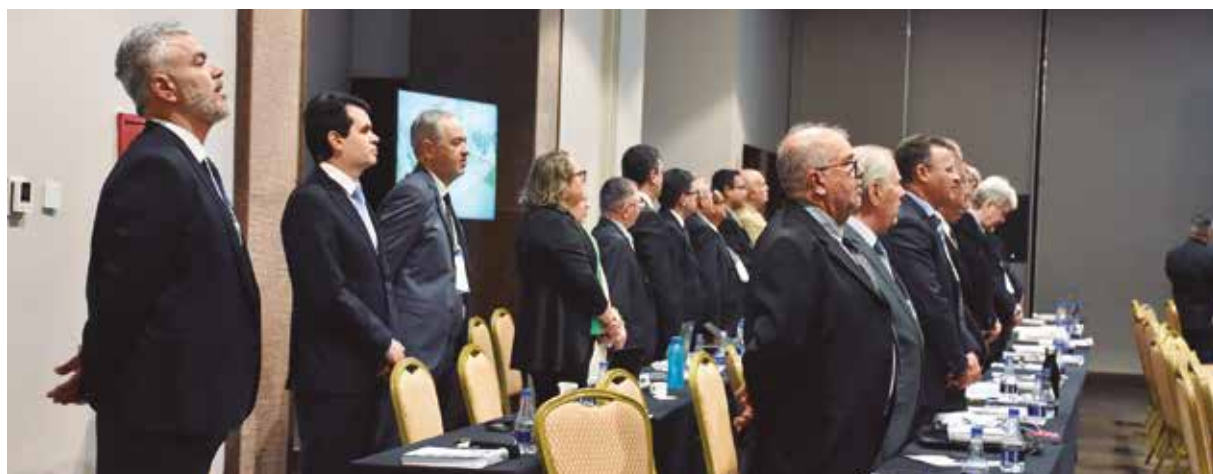
As lideranças reunidas em Brasília definem as prioridades das principais ações legislativas, políticas e jurídicas a serem defendidas em prol da categoria ao longo do ano

No encontro, foi reforçado também o compromisso de todo o Sistema com o engajamento de dirigentes e colaboradores dos conselhos de todo o país com a modernização e a busca de maior eficiência que estão em curso. Para isso, diversas resoluções estão sendo alteradas para garantir as mudanças e a consequente agilização dos procedimentos em prol da categoria.