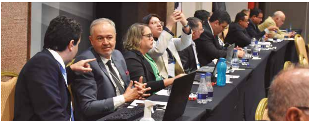
A segunda Reunião Plenária dos Delegados do Sistema, realizada em julho, recebeu dirigentes de todo o país e representou um importante fórum de decisões sobre as iniciativas a serem realizadas em 2023

Há, portanto, maior garantia de que uma decisão tomada pelo Core-MG, por exemplo, será a mesma deliberada pelos conselhos regionais dos demais estados. O que se decide em Minas é o mesmo que irá ocorrer no Amazonas ou no Rio Grande do Sul – e assim por diante.