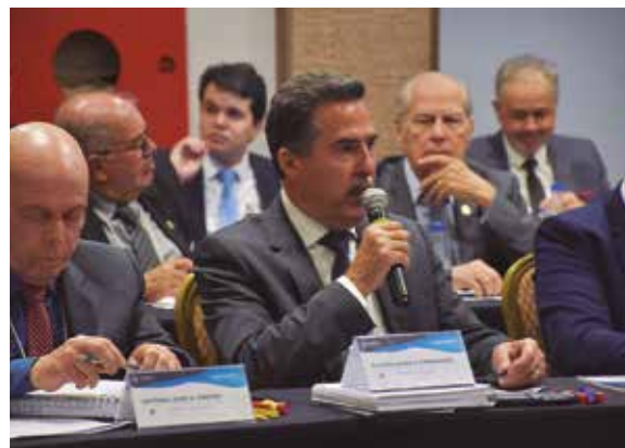
O presidente Álvaro vem participando ativamente dos encontros nacionais do Sistema Confere-Cores