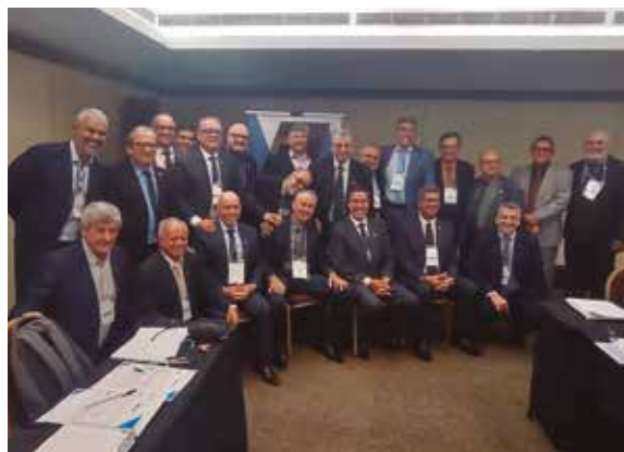
Lideranças de diversos estados participaram da Primeira Plenária dos Delegados em 2023

anos de relevantes serviços prestados ao Sistema Confere-Cores. Ele também recebeu o Troféu “O Mascate”, maior honraria do Conselho de Pernambuco;