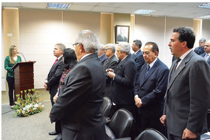
Reunião foi realizada na sede do Conselho Federal dos Representantes Comerciais (Confere), no Rio de Janeiro