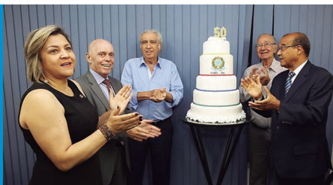
Em 2017, Representantes e convidados celebraram os 50 anos na sede do Core-MG