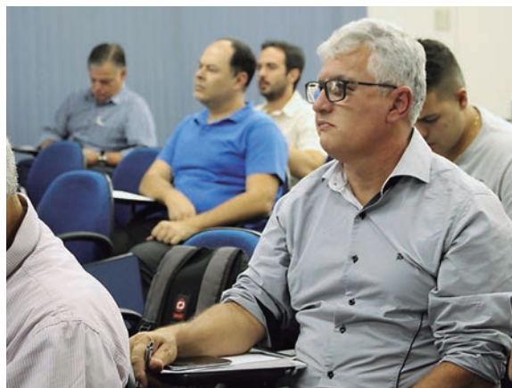
Representantes Comerciais de BH e região participaram do primeiro evento