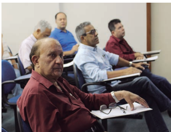
Profissionais tiraram muitas dúvidas acerca dos direitos e deveres do Representante Comercial