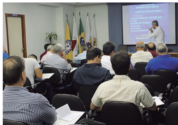
Primeiro encontro foi realizado em abril, na Sede do Core-MG