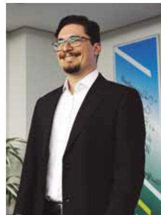
Mateus destacou a vivência de mercado dos participantes

Todos tivemos de ir para a internet, para as reuniões online, para o trabalho remoto e para o uso intenso das redes sociais. Todos os profissionais estão carentes de refletir mais sobre isso e compreender melhor as formas de atuar de maneira eficiente no contexto dessa nova realidade".