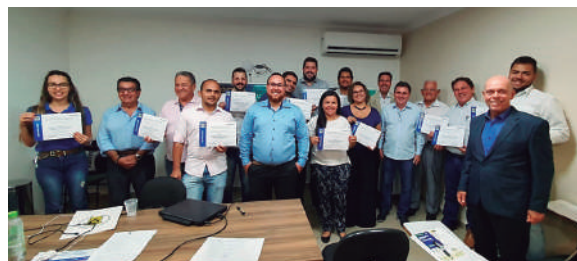
Em Uberaba, a entrega dos certificados