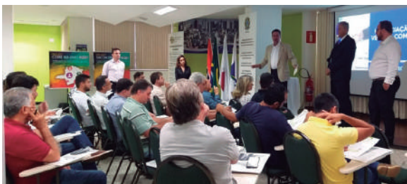
Representantes prestigiam evento em Divinópolis