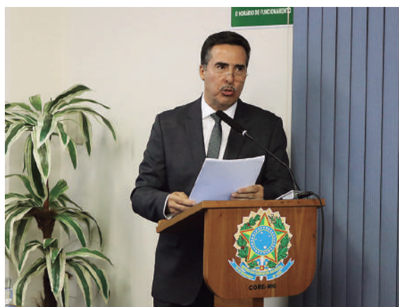
O presidente Álvaro Fernandes destacou as principais ações das entidades no período