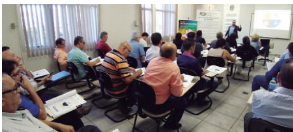
O evento ocorreu com sucesso em Montes Claros

Para o próximo ano, os projetos continuarão a ser executados, com outros temas de interesse da categoria. Fique ligado nos sites das entidades pois, em breve, será divulgada a agenda de eventos para 2020.