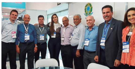
Diretores e funcionários do Core-MG e do Sircom presentes no estande na Superminas

presentantes Comerciais – quer pessoa física ou jurídica. O Core-MG tem participado, também, de inúmeras outras feiras e exposições em diversas cidades do interior de Minas. Recentemente, a entidade esteve presente, por exemplo, na Super Inter, em Uberlândia, assim como na Sevar, em Juiz de Fora.