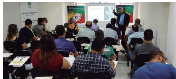
Participantes acompanham workshop em Varginha