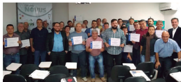
Entrega de certificados na sede de Juiz de Fora