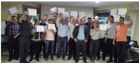
Categoria presente em Governador Valadares