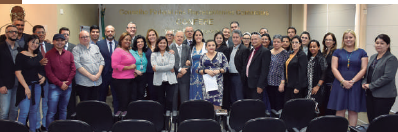
Um dos encontros reuniu coordenadores de Cores de diversos estados, incluindo MG